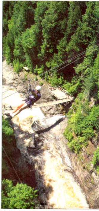
L'étroitesse de la base de cet entonnoir de 74 m de hauteur laisse imaginer la profondeur de la partie invisible et la force du courant qui y pousse les eaux de la rivière Sainte-Anne du Nord. Ce site, maintenant équipé de trois passerelles, attire les visiteurs depuis 30 ans. Bien des gens retiennent leur souffle à la vue de ceux qui s'initient à des activités comme la « tyrolienne » ou traversée du ravin sur câbles et poulies.

L'hypothèse d'une mini-centrale au canyon Sainte-Anne a aussi soulevé un tollé de protestations. Du haut de la passerelle McNicoll (du nom de la famille des propriétaires du site), à 60 m au-dessus du gouffre, la vue est vraiment à couper le souffle. Bien des gens retiennent encore plus le leur à la vue de ceux qui s'achètent des montées d'adrénaline en s'initiant à des activités comme la « tyrolienne » ou traversée du ravin sur câbles et poulies.