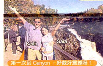
第一次到 Canyon，好棒好震撼呀！

要挑戰最後一道也最短的吊橋，先得走 187 級樓梯。從第二道橋仰頭看看，方知第二道吊橋原來真的高不可攀！站在橋中，放眼望，前方一片遼闊，河谷水面上大點大點的紅黃綠青藍紫，這種風光是！我再踏上驚險旅程多一次！完全值得。