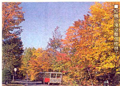
■紅楓已淹沒整個樹林了!

淹在紅楓的世界，是看上三個秋天也不會悶……離開魁北克市不過半小時車程，沒有浪漫的法式建築，卻換上震撼的山谷瀑布。橫渡於三條觸目驚心的吊橋上，瀑布風光更是磅礴。怕自己沒膽量挑戰嗎？那麼踩着單車看看 Le d' Orleans 島的農村風光，又是另一番秋之體驗！